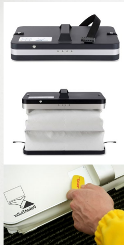
Boxenstopp Bestellungen werden einfach in die Box gelegt

Beim ungeliebten Nachbarn klingeln, um das Paket abzuholen, oder gar bis zum nächsten Paketshop oder zur Post laufen? Diese wenig erbaulichen Aktionen könnten bald der Vergangenheit angehören. Der PaketButler ist, so der Anbieter, eine diebstahlsichere Box, die seit Kurzem in ausgesuchten Regionen eingesetzt wird. Die intelligente Annahmestelle ist mit einem Gurt fest an der eigenen Wohnungstür verankert. Über Anlieferung und Abholung wird per kostenloser App kommuniziert. 249 Euro oder 7,99 Euro Miete/Monat. www.paketbutler.com