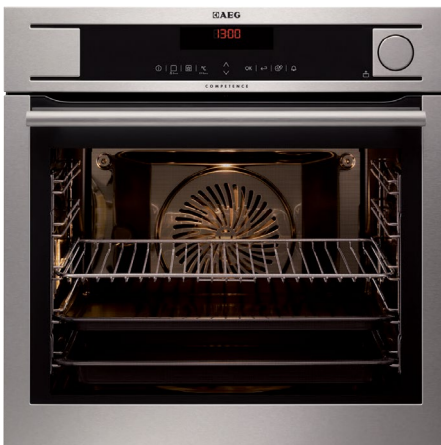
BS 8304101 M

Bereits vor 25 Jahren haben wir erkannt, dass die besten Ergebnisse im Ofen durch die perfekte Kombination von Dampf und Hitze entstehen. Seitdem haben wir immer wieder innovative und intelligente Dampfgarer auf den Markt gebracht*. Mit dieser umfangreichen Erfahrung präsentieren wir, die Pioniere des Dampfgarens, heute eine breite Auswahl an Multi-Dampfgarern, die sich durch außergewöhnliche Technologien auszeichnen.